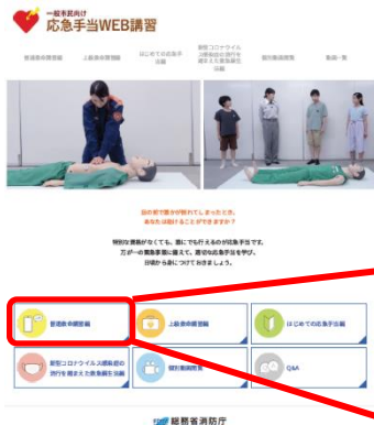
応急手当 WEB 講習ホーム画面

https://www.fdma.go.jp/relocation/kyukyukikaku/oukyu/index.html