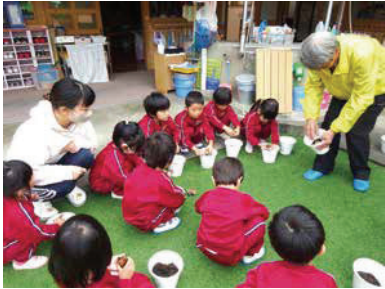
綾東こども園（十倉名畑町）での人権の花運動（令和7年10月22日）

人権擁護委員は、法務局と連携しながら、相談者の人権を守り、問題解決を支援するほか、社会全体の人権意識を高める活動も行っています。その一つが「人権の花