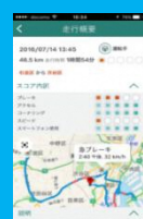
安全運転のヒント