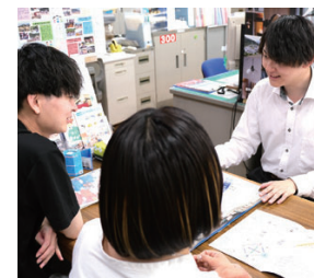
昨年は、窓口にて2,115件の相談が寄せられました

HPで多様な「コンテンツ」展開 市は、移住・定住をワンストップで支援するため、平成20年度に窓口を開設。空き家バンクの登録物件の紹介・案内だけでなく、就業・就職相談や地域住民との顔合わせへの同行など、きめ細かなサポートを行っています。 情報発信では、「移住立国あやべ」のホームページの充実に注力。空き家情報のほか、ボランティア組織「こらへんのことつたえ隊」と連携し、移住者のインタビュー記事や市内12地区の紹介動画などを、さまざまなコンテンツを展開しています。令和6年に始めたSNSでの広告配信により、ホームページへのアクセス数は増加中。今後も、移住者の視点に立った情報発信に努めます。