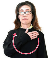
右手で体を丸くする