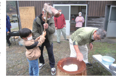
12月に開く餅つき。子どもからお年寄りまで幅広い世代が参加している