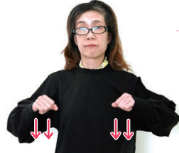
胸の前で両手を握り同時に2回下ろす