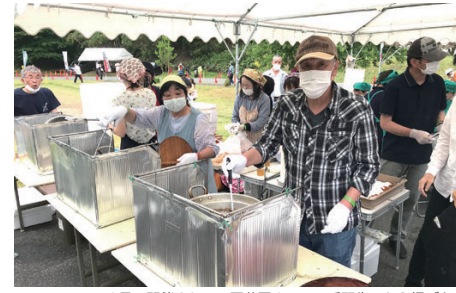
6月に開催される二王公園まつりで手羽先のから揚げを販売。今年（6月7日）も出店し、まつりを盛り上げる

国宝・光明寺二王門（睦寄町）の麓に位置する▽有安▽古井▽市場▽庄一の4つの集落から成る水源の里・有安。地域のつながりを