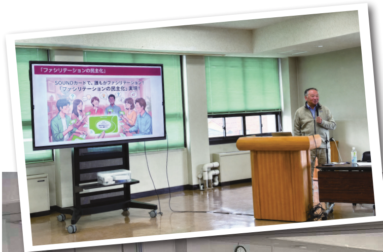
議員研修会 (テーマ:議員間討議について)