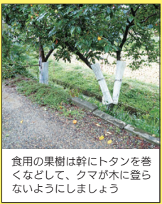
食用の果樹は幹にトタンを巻くなどして、クマが木に登らないようにしましょう