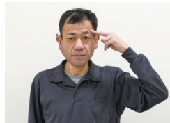
こめかみに付ける