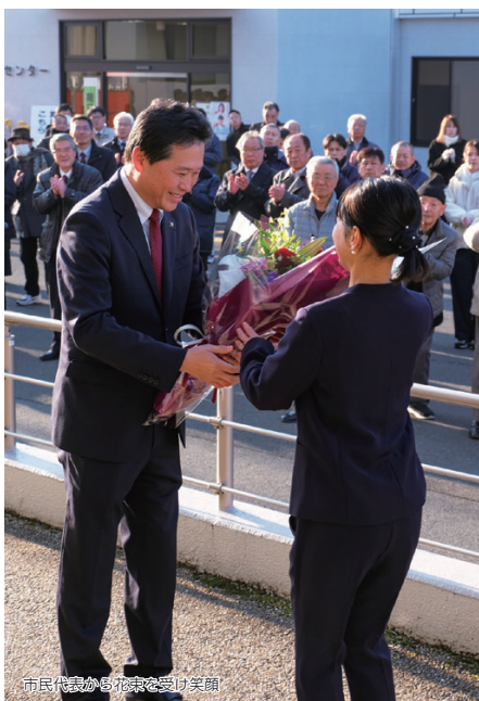
市民代表から花束を受け笑顔