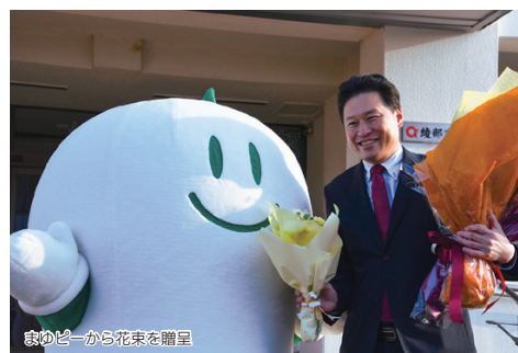
まゆびーから花束を贈呈