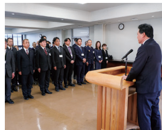
管理職約70人に前に訓示

市役所は、市民の皆さんが安心してそのものだと思っています。職員が「仕事しやすいかどうか」ではなく、市民にとって「良いか悪いか」。市民の皆さんがどう受け止めるかを常に念頭に置いて行動していただきたいと思います。