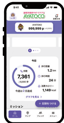
アプリ移行後のホーム画面