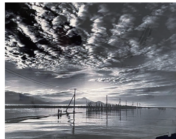
写真の部「海床路」 村上正美（味方町）

実像と水面に反射する虚像との描き分け、遠景に見える山々の色、手前から奥へと変化させながら描かれているリズムのよい筆の運びなど、技術の高さを感じます。