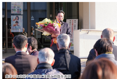
集まった市民や市職員に決意と抱負を表明

任期満了に伴う綾部市長選で初当選を果たした四方源太郎市長が2月2日、第20代綾部市長として初登庁しました。四方市長は市役所玄関前で、約300人の市民や市職員に迎えられあいさつ。「3万人の力で、綾部市を地方都市のモデルへ」と決意を述べました。