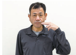
唇の下に付けた2指を