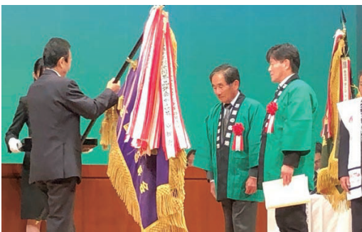
11月2日、静岡県浜松市で行われた表彰式。審査成績が最優秀の市町村（産地）に授与される優勝旗が、本市に手渡されました

全国から出品された茶の中から、その年の優秀な茶を選定する「全国茶品評会」。かぶせ茶や玉露、てん茶などの8部門で、色や香り、