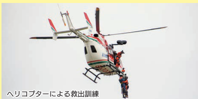
ヘリコプターによる救出訓練

総務省消防庁、府、綾部市、福知山市、舞鶴市は10月26日と27日の両日、令和6年度近畿府県合同防災訓練を福知山市などで実施しました。訓練は、大雨が続く中、福知山市を震源とする震度6弱の地震が発生したと想定。近畿2府4県と福井県、三重県、徳島県から自衛隊や消防など約100機関、2,200人が参加し、救出訓練や消火訓練、避難所運営訓練などを行いました。