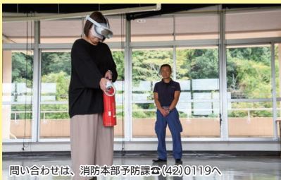
問い合わせは、消防本部予防課 ☎(42)0119へ

市はこのほど、消防本部にAR（拡張現実）技術を活用した防災訓練機器を導入しました。専用のゴーグルを着用することで、職場など実際の景色に火災の煙や炎が重なって見え、リアリティーのある消火体験をすることができます。導入金額は約150万円。消防職員立会いのもと、事業所や自治会等での訓練指導、講習会などで活用します。