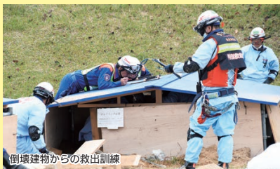
倒壊建物からの救出訓練