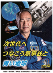
次世代へ つなごう無事故と 青い地球