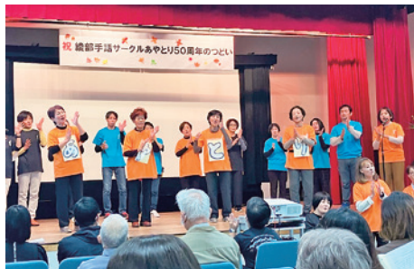
10月29日に西町一丁目のI・Tビルで開かれた「50周年のつどい」。当日までに、3色のオリジナルTシャツやサークルソングを制作し、会場で披露しました

同サークルの会員は現在、市内外から集まる20〜80代の41人で、月2回の例会のほか、花見や忘年