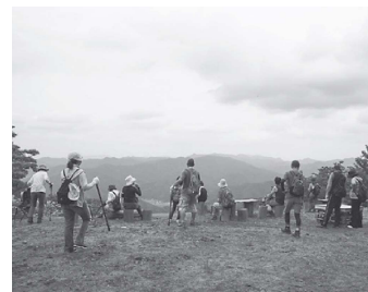
絶景のシデ山山頂「みと広場」でくつろぐ登山客

豊かな自然を観光資源に活用 過去にカヤの収穫に利用していたシデ山を観光資源として活用しようと、平成22年から地域の有志が林道の整備や登山会などを開始。6つの滝や雲海が見られる山頂からの眺望などが人気を呼び、