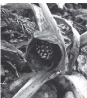
※単子葉植物…最初に生えてくる葉っぱの枚数が1枚の植物のこと

ヒメザゼンソウは、単子葉植物（※）・サトイモ科・ザゼンソウ属の植物です。「ザゼンソウ」は、仏様が座禅しているような姿に見えることからその名前が付きました。そして「ザゼンソウの小さいもの」という意味で「ヒメ」が付く「ヒメザゼンソウ」と呼ばれています。中央は、小さな花が多く集まった花序（肉穂花序）。その花序を背後から取り囲むのは、濃