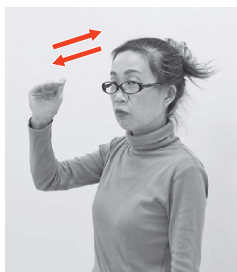
右手4指を曲げ、指先で頭をかくくさをする