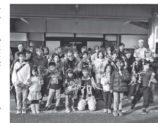
12月10日、餅つき体験会には子どもや大学生などが多く参加した

豊かな自然を観光資源に活用 過去にカヤの収穫に利用していたシデ山を観光資源として活用しようと、平成22年から地域の有志が林道の整備や登山会などを開始。6つの滝や雲海が見られる山頂からの眺望などが人気を呼び、