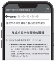
確定申告書の作成はこちらから

市・府民税の申告が必要な人は、令和6年1月1日現在で本市に住所があり▽令和5年1月1日～12月31日に所得があった人▽所得税の申告が不要な公的年金受給者等で、配偶者控除等を追加する人や公的年金等のほかに20万円以下の所得があった人―など。市役所での申告は予約優先で、2月1日（木）から予約受付を開始します。希望日の前々日（土・日曜日、祝日除く）までに、受付専用ダイヤル☎（42）1261（平日午前9時～正午、午後1時～5時）へ電話するか、予約フォーム（2月1日