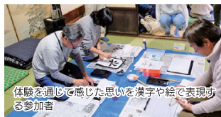
体験を通じて感じた思いを漢字や絵で表現する参加者