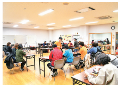
例会は、毎月第2・第4木曜日の午後7時から保健福祉センター(青野町)で。手話の勉強をしたり、手話を使ったゲームをしたりしています。飛び入り参加可能です