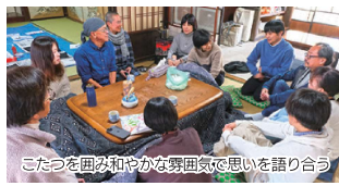
こたつを囲み和やかな雰囲気と思い語り合う