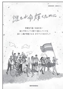
すべての人が輝いて生きられる世界を目指す啓発ポスター

月間に合わせ、市と関係団体は8月4日、街頭啓発を実施II写真「みんなで創る人権のまち。綾部」を目指し、市民一人ひとりが人権について考える機会となりました。