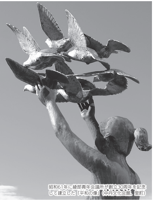
昭和61年に綾部青年会議所が創立30周年を記念して建立した「平和の像」(中丹文化会館、里町)

終戦から78年。戦時中のことを知る人が少なくなっています。一方、世界ではまだ戦争や紛争の惨禍が続き終わりは見えません。本市は、「平和」を市是に掲げ、関係機関が連携し、世界平和に向けた取り組みを行っています。この機会に、あらためて平和について考えてみませんか。