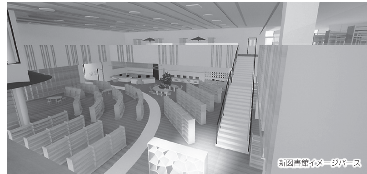
新図書館イメージパース