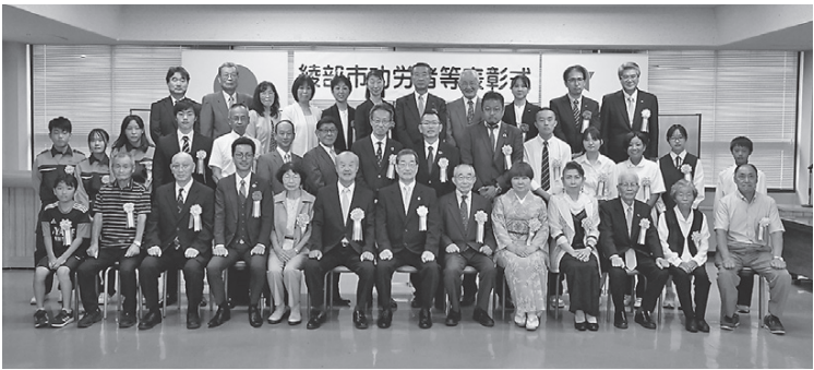
被表彰者の皆さん

市は8月1日、功労者等表彰式を開催。功労者5人、篤志者3人・4団体、分野別功績者16人・3団体を表彰しました。被表彰者は次の皆さんです（敬称略、順不同）。