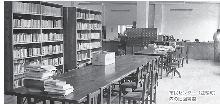
市民センター (並松町) 内の旧図書館