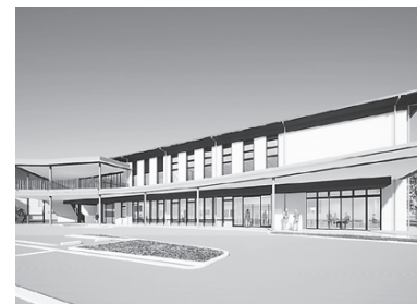
移転先の複合施設イメージパース