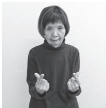
両手の親指と人差し指を上に向けて左右に並べ