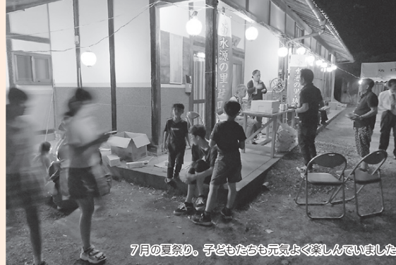
7月の夏祭り。子どもたちも元気よく楽しんでいました