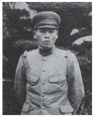
の所らりりて北写んのさ集つば 近も代歩・川の内さ集つば 人からりち父・さん内収ずの お守り父さん内収ずの にる夫・熊内さん内収ずの 春真。は遺骨中、した 活動胸に とせて

「戦争の記憶はないが、貧しかったことは覚えている」と熊内さん。「私たちがきょうだいに食べさせるために自分は食べなかった」と母をしのび「戦争は、遺族に悲しみ