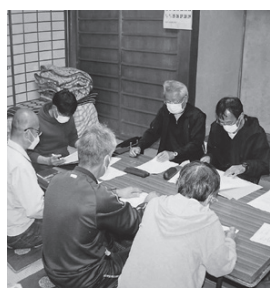
住民同士で勉強会を実施

集落の今後について勉強会を開催 志賀郷地区北西部、福知山市と舞鶴市に接する坊口。令和4年8