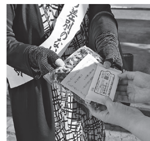
人権啓発グッズを配布しました

多様性(ダイバーシティ)とは、集団の中で年齢や性別、人種、経験、障害の有無、性的指向、性自認などが異なるさまざまな人たちが共に存在すること。その個性を互いに認め合うことが大切です。「普通は○○だ」「男(女)はこうあるべきだ」という決め付けや押し付けをしてはいけません。「自分と違う」からといって排除せず、個々の個性に目を向け、すべての人が心豊かに暮らせるまちを目指しましょう。