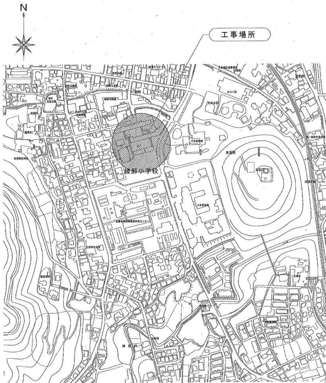
綾部小学校エレベーター整備工事 付近見取り図 1/2,500