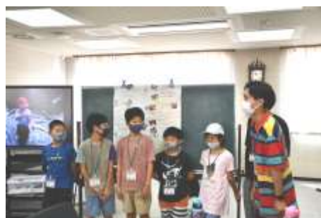
2日目：レポート作成・発表