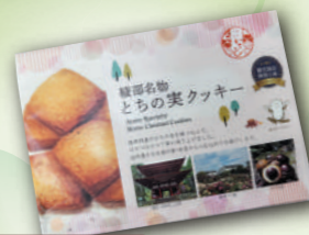
とちの実クッキー