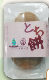
とち餅 (水源の里 老富)