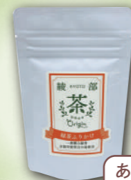
あやべ緑茶ふりかけ (自然素材オリジン)