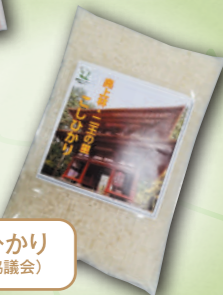
奥上林こしひかり (奥上林地域振興協議会)