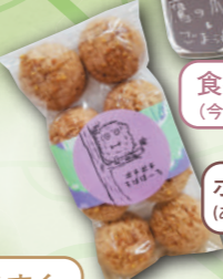
ポチポチそばぼーろ (あじき堂)