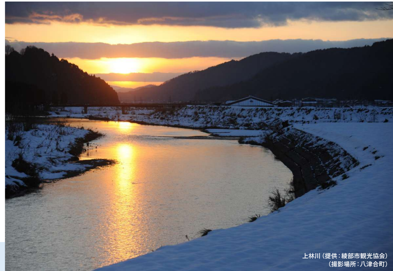
上林川 （撮影場所：八津合町）

●種目及びエントリー料金／定員 ① あやべ 50K：15,000円／500名 ② あやべ 15K：4,500円／300名