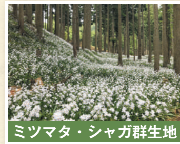
ミツマタ・シャガ群生地