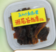
瀬尾谷粕漬け (瀬尾谷粕漬加工所)