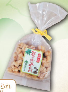
とちの実あられ (水源の里 古屋)