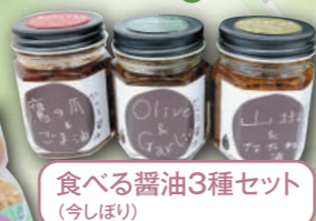
食べる醤油3種セット (今しぼり)