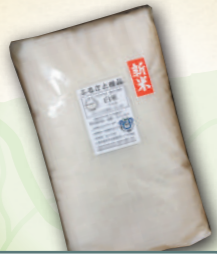
綾部産新米 (かかりつけ米農家 井上吉夫)