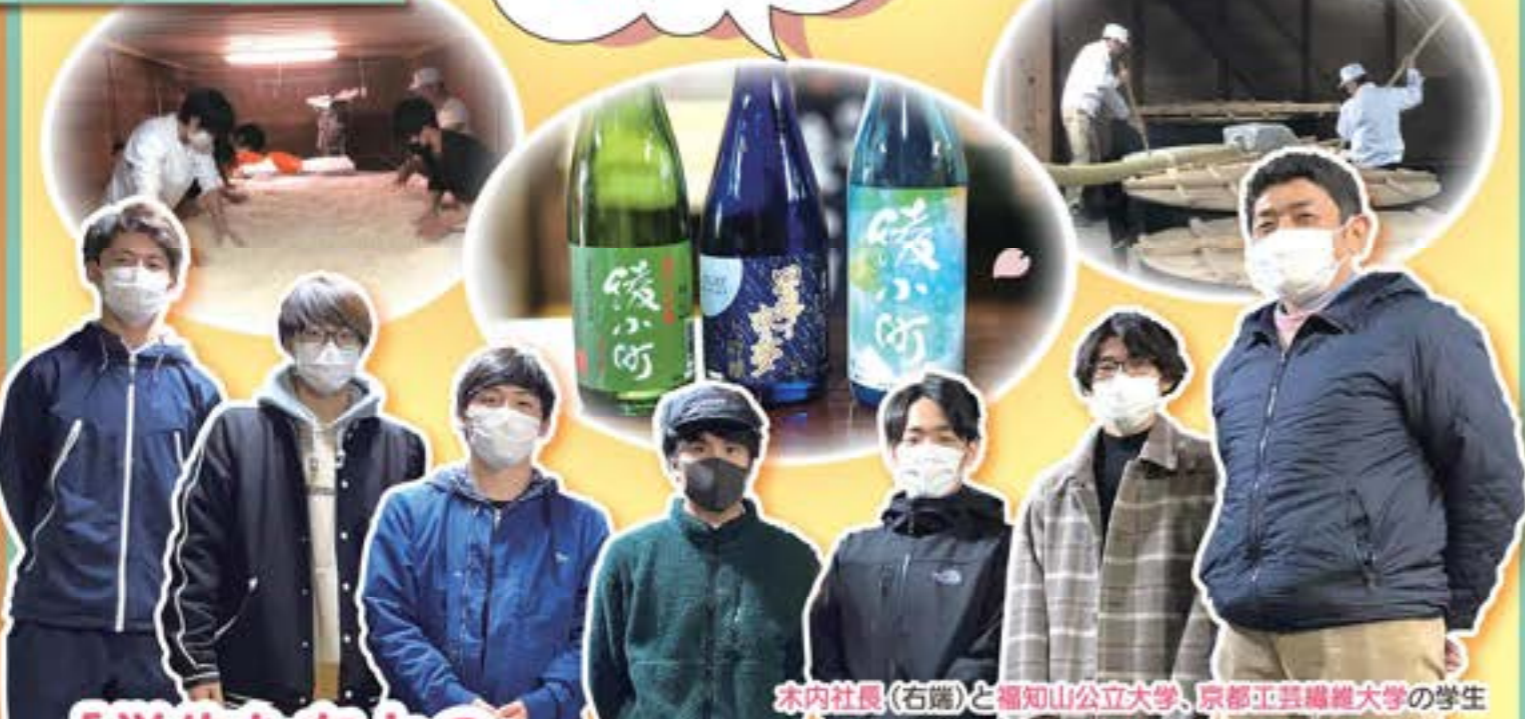
木内社長(右端)と福知山公立大学、京都工芸繊維大学の学生