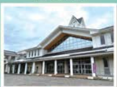
今：豊里小学校 平成11年4月に豊里西、東小学校の統合により誕生しました。