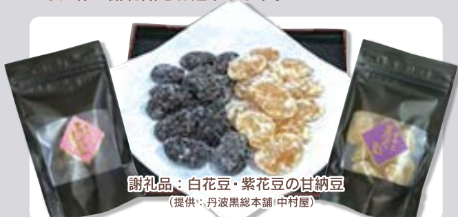
謝礼品：白花豆・紫花豆の甘納豆 (提供：丹波黒総本舗 中村屋)

※お手数ですが、ご本人同意のうえ、同封の会員紹介はがきにてご紹介ください。 ※謝礼品は追ってお送りいたします。