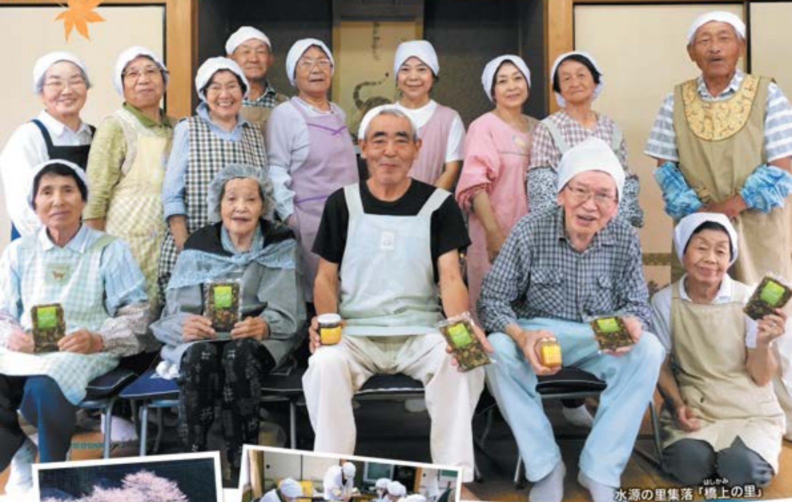
水源の里集落「橋上の里」