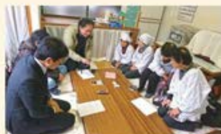
水源の里 清水での取材風景

今回15集落をまわってお話をうかがいましたが、皆さん、とても生き生きされていて、こちらが元気をいただきました。かつてこの地を訪れた菅原文太さんは「水源の里の方々は品格がある」と評されたことがあるそうです。もちろん、それぞれにご不便やご苦勞もありません。得られるものがいっぱいありました。それを読みやすくまとめています。ひと目で様子がわかる写真もたくさん入れていますので、ふるさと綾部を見直す、誇りに思う一助にいただければ幸いです。