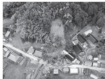
平成30年7月豪雨では土砂崩れにより3名の命が奪われました