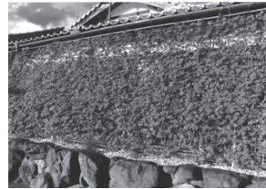
昨年度の同コンテスト最優秀作品

の遮蔽率が50〜60%、遮蔽ガラスでも55%程度で、グリーンカーテンの効果の高さが分かります。環境省ホームページ参照。