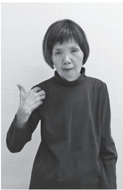
右手5指を折り曲げ、指先を肩に付ける (任を肩に負う意味の表現)