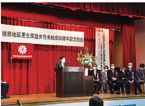
4月13日、西町一丁目のI・Tビルで結成60周年記念式典を開催

同会の活動内容は▽青少年の育成や犯罪の抑制などに関する研修会への参加▽受刑者に対する図書