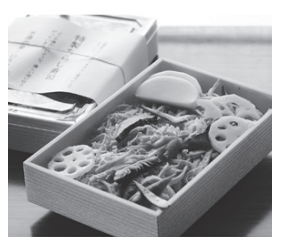
旬の食材を取り入れて作るちらし寿司