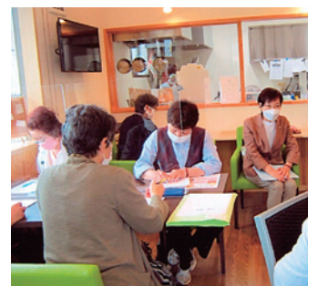
社会福祉法人綾部福祉会「ともの家」で行われた理事会

購入費用の寄付▽更生保護施設での手芸や折り紙による交流—など。また、市内の子ども食堂の取り組みに協力し、子どもたちの話し相手になったり、ゲームを楽しんだりして、子どもの居場所づくりを支援しています。このほか、市内の各施設を訪問する「移動理事會」Ⅱ写真Ⅱや同会を地域別の14地区に分け、地域の課題等を話し合う「ミニ集会」を開催するなど、地域に根差した活動を大切にしています。