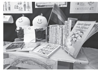
市図書館では、プライド月間に合わせ関連図書などを展示しています。赤・オレンジ・黄・緑・青・紫の6色から成る虹色の旗は、性の多様性を表すシンボルです

多様な性の在り方はSOGI（ソジ）と表現されます。SOGIは、性を考える4つの要素Ⅱ下表Ⅱのうちの性（性的指向）と（好きになる性（性的指向））とGender Identity（心の性（性自認））の頭文字を合わせた言葉です。これは、LGBTをはじめとする性的マイノリティ（少数者）だけでなく、全ての人に関わる概念。私たち一人ひとりが多様な性の当事者であることを表します。