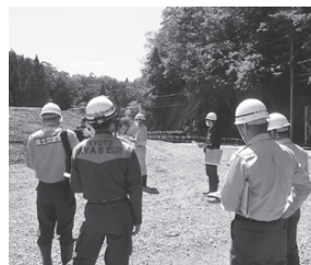
市は5月31日、防災関係機関と土砂災害などの危険箇所を点検する防災パトロールを行いました