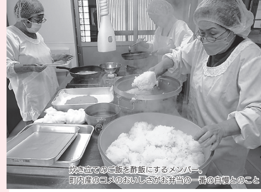
炊き立てのご飯を酢飯にするメンバー。町内産のゴシのおいしさがお弁当の一番の自慢とのこと

季節ごとに多くの観光客が訪れる「山家城址公園」。同公園のある広瀬町は、かつては仮装行列や村祭りなどで活気がありました