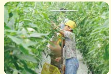
万願寺あまとう収穫体験