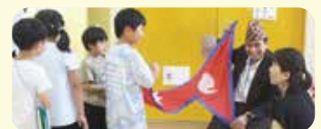
日本語学校学生と交流