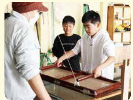
黒谷和紙 卒業証書手漉き体験