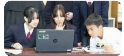
プログラミング学習