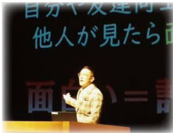
全綾部市人権教育研究集会