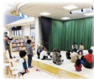
おはなし会(図書館)