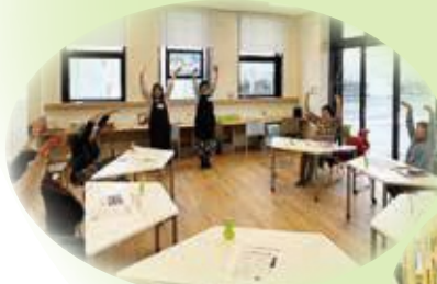
脳イキイキ! 音読の会(図書館)