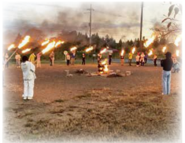
綾部ジャンボリー