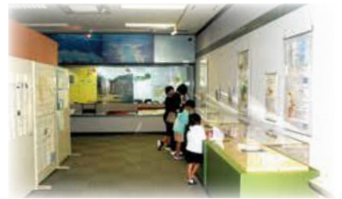
小学生の夏休みの自由研究作品展