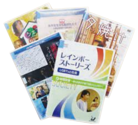
人権教育・啓発のためのDVD等