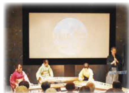
中秋の名月コンサート(天文館)