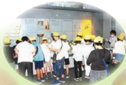
資料館常設展示の説明