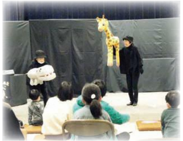
子育て親育ち講座