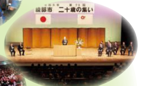
綾部市二十歳の集い