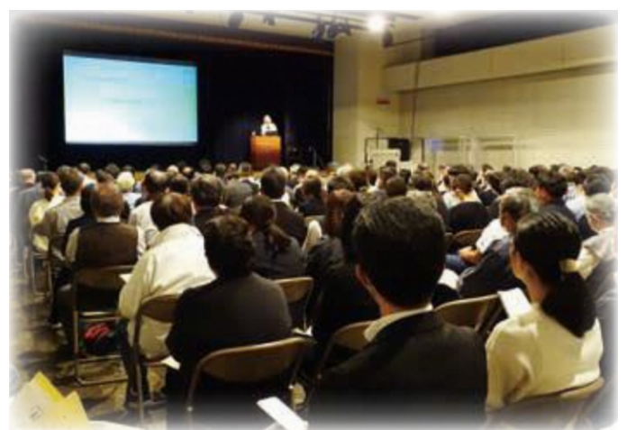
人権を考えるセミナー