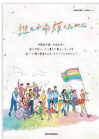
人権啓発ポスター