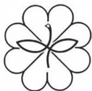
民生児童委員のシンボルマーク