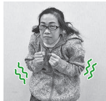
両手を握り体を震わせる