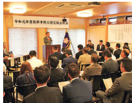
総会では加盟する事業者が一堂に会し、各事業の報告や事業者間の親睦を図る

開催(写真②)▽気象予報士や防災アドバイザーによる講演会(写真③)の開催▽自治会などへ防災用品の寄贈などを実施。平成30年に発生した水害時には、同会を通じ多くの支援物資やボランティアが集まりました。同会では活動に賛同する会員を募集しています。問い合わせは事務局の消防本部☎(42)0119へ。