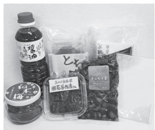
本年度のふるさと産品の一例。「ふるさとを思い出しながら楽しみたいと思います」と人気です

「あやべ特別市民制度」は、本市出身者やゆかりのある人、関心のある人に市を応援してもらう制度です。会員には年3回の特産品に加え、会報（ニュースレター）や市内飲食店の割引券などを送付しています。特産品の送り先は、会費負担者以外の住所も指定でき、友人や親戚への贈り物として