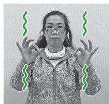
2指で作った輪をひらひらさせながら下ろす(雪が降る様子)