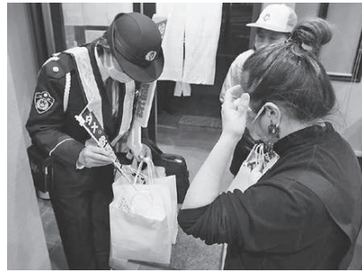
12月1日、年末の交通事故防止府民運動がスタート。市内飲食店を回り、飲酒運転根絶への協力を呼び掛けるなど、関係団体による啓発活動が実施されました