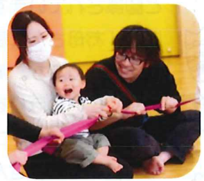
笑顔があふれる時間でした♡

さて、5月も手・足形製作に誕生会(4・5月生まれさんお祝い☆誕生児以外も大歓迎♡)子どもの日ごっこに・・・とイベント盛りだくさん!そして去年も大人気だった、汚れない感覚あそび・フィンガーペインティングも!キャンバスをご持参いただいて、絵の具遊び!