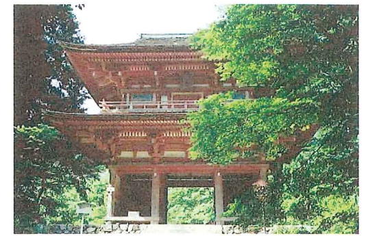
国宝建造物二王門