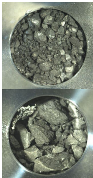
回収容器に移されたサンプル (上:A室 下:C室)

初めにA室が開封され、直径数ミリの黒い粒子が多数入っていることが確認されました。その後開封されたC室にも黒い粒子が多数入っており、最大で1センチに達するものもありました。