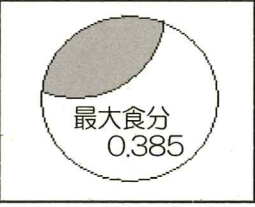
京都での日食の時刻(表)と最大時の様子(図)