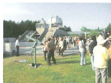
(平成24年の日食観望会の様子)

屋外にて、小型望遠鏡・日食グラスを 使った観望会を実施します。 雨天・曇天の場合は中止いたします。