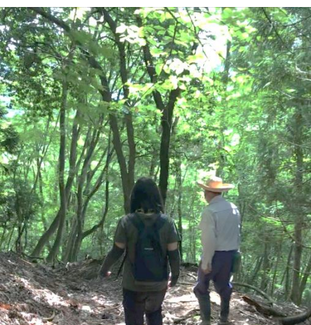
← 暑い日でしたが、緑の中は涼しく気持ちよく散策ができました。

市志と光野の道はそれぞれ違いがあり、市志はミツマタの木々の道を通り、光野は広葉樹の緑豊かな道となっています。急な道なので決して容易ではありませんでしたが、難所も含めて楽しく歩くことができました。