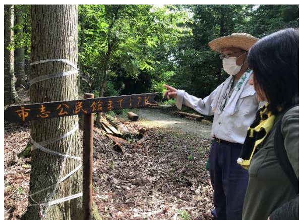
→ 峠には看板や手作りのベンチがあります。