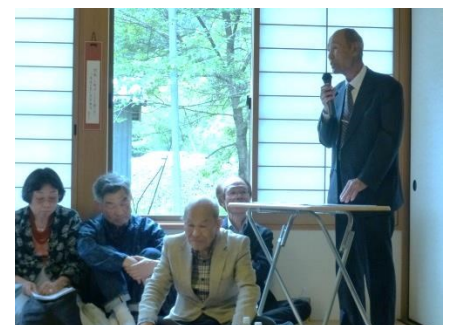
西田氏の講演は参加者をひきつけた

終了後は会場を市茅野のシャガ群生地へ移し、参加者はシャガを鑑賞したほか、特産品である栃餅ぜんざいを味わいました。