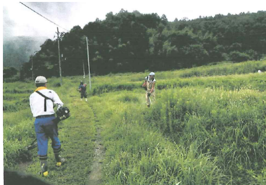
休耕田の維持管理