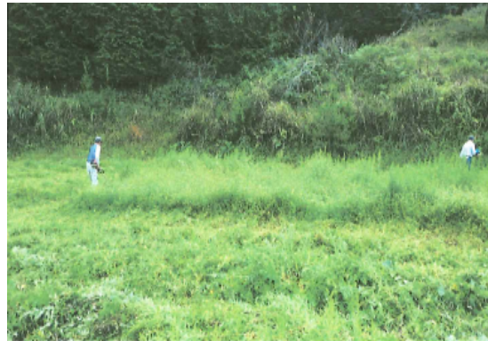
休耕田の維持管理