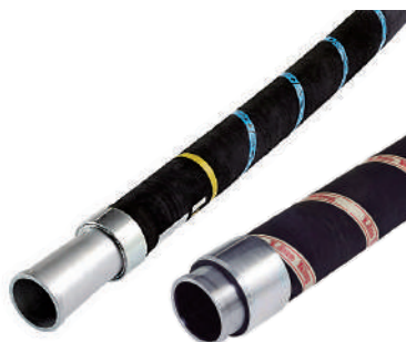
運ぶものに合わせてゴムの厚さや材質を変え、製造する搬送用ホース

建設機械などに欠かせないホースを製造し、産業を下支えしている会社です。今回は、高圧ホースと運送用ホース、会社概要をパネルで詳しく紹介しています。ぜひ一度ご覧ください。