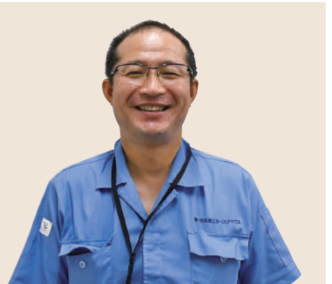
住友理工ホーステックス

同社は顧客のニーズに合わせた製品を提供するため、1000種類以上の製品を扱っています。今回展示するのは、主力製品である、建設機械などに使われている高圧ホース。重機を動かすために必要な油圧を送る部品です。また、生コンクリートやオイル、魚など、液体から個体までさまざまなものを運ぶ運送用ホースも展示されます。