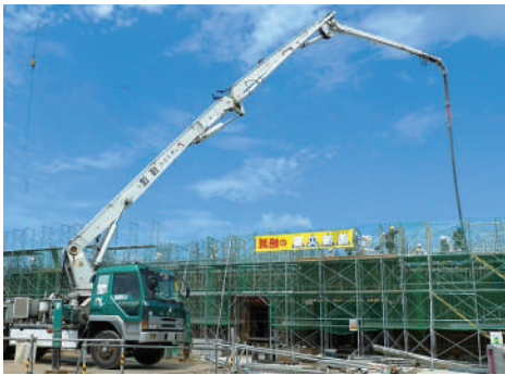
ホースが1つ無くなると、工事が中断するほど重要な部品

住友理工ホーステックス（本社、とよさか町）は平成25年、住友理工グループの産業用ホース事業部の製造拠点として設立。平成28年に同事業部の運営拠点が同社に移り、グローバル展開の中心を担っています。同社は主に、産業用のホースを製造。各種産業機械などに多く使われています。