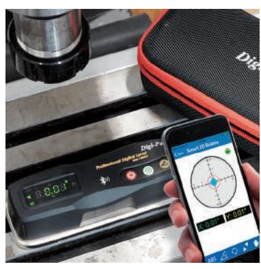
▲タブレットと同期し測定結果が記録できる「2軸精密デジタル平型水準器」