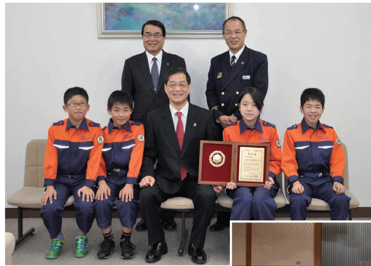
受賞をうけ3月27日に市長報告