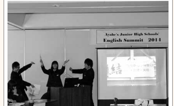
中学生英語サミット (昨年の11月から)