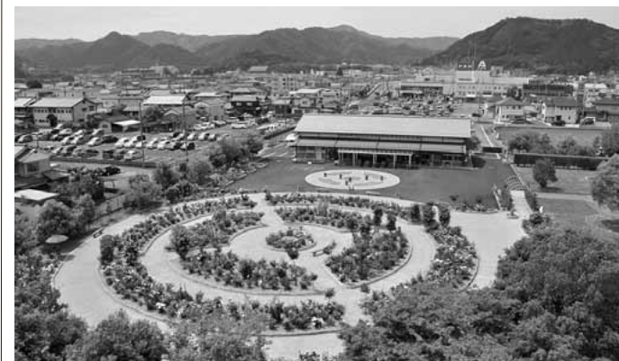
観光推進の拠点となる「あやべグンゼスクエア」