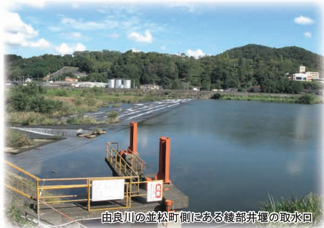
由良川の並松町側にある綾部井堰の取水口

綾部の由良川には以前、農業用水を取るための大きな井堰が3か所に設けられていた。綾部井堰と栗村井堰、天田井堰である。天田井堰は1866年（慶応2年）の洪水で被害を受け、綾部井堰と水路をつなぐことによって廃止された。現在は、綾部井堰と栗村井堰が、農地を豊かにしている。