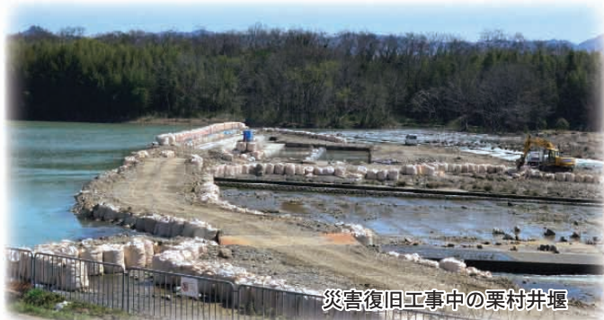
災害復旧工事中の栗村井堰