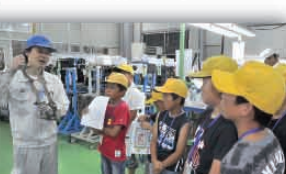
ものづくり体験ツアー