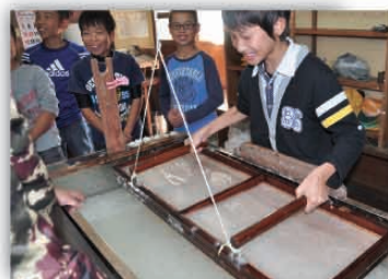
市長のふるさと講座

人や文化・自然とふれあい、英語を使ったコミュニケーションを経験する中で、社会を知り将来を考えるためのさまざまな取り組みを推進しています。