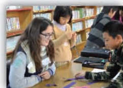
大学留学生と交流