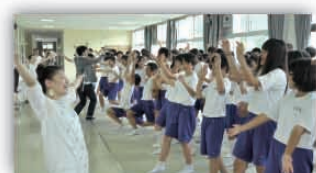
演劇ワークショップ