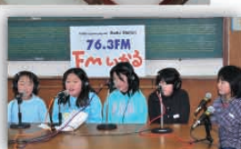
FMIかるラジオパーソナリティ体験