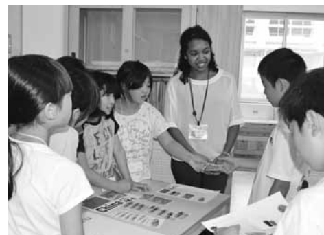
レストランで注文の仕方を練習