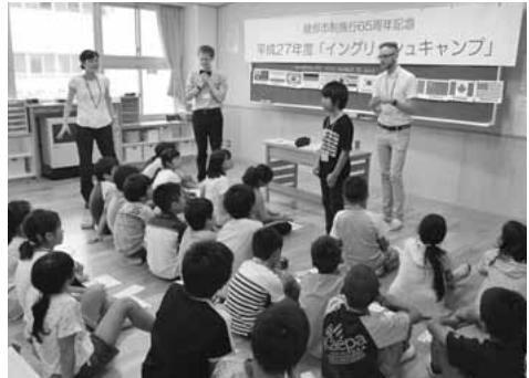
国旗を使いゲーム形式で学習