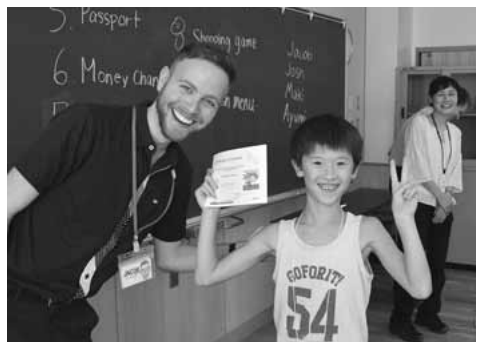
イングリッシュキャンプ終了後、修了証書授与