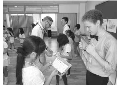
ネームカードを使って自己紹介