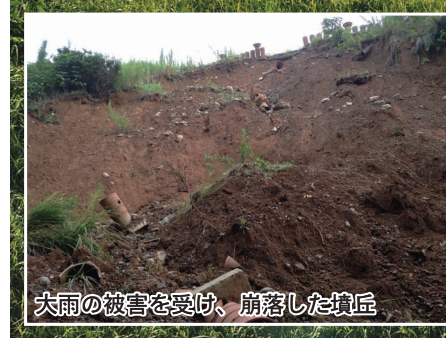
大雨の被害を受け、崩落した墳丘

昨年8月の記録的な大雨により墳丘の一部が崩落した私市円山古墳（私市町）の修復工事が、今年9月に完了。10月からは、土・日曜日の夜間ライトアップも再開しました。