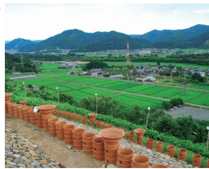
墳頂からは市内が一望できる

私市円山古墳は約1500年前に由良川流域を治めていた王の墓とみられています。直径は約70㍍、高さ約10㍍で、円墳としては府内最大。国史跡に指定されています。同古墳は、昭和63年の舞鶴若狭自動車道建設に伴う事前調査で発見されました。市民らから保存の熱い要望を受け、道路建設の工法を変更して古墳を保存し、市が古墳公園として整備することが決定。市民の寄付でレプリカの埴輪や葺き石を並べて復元しました。平成5年に開園した同公園は市のシンボルのひとつとして、市民や観光客に親しまれてきました。