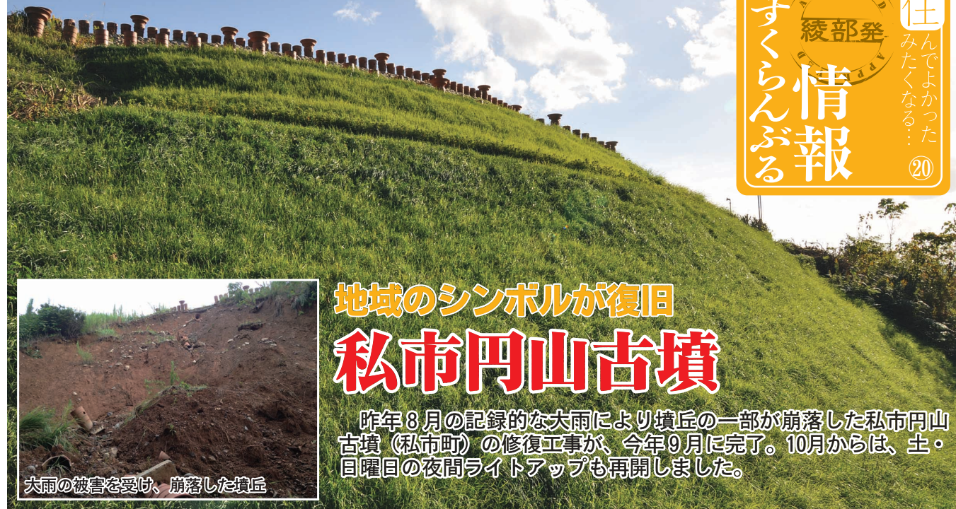
修復が完了した墳丘