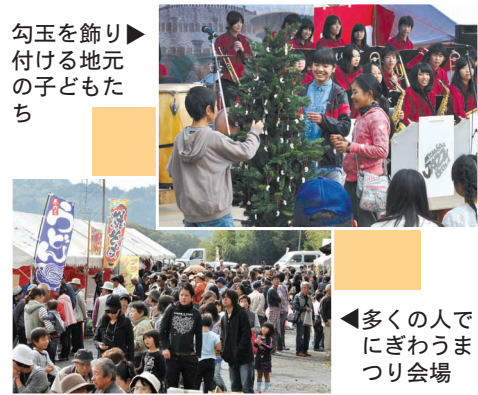
勾玉を飾り付ける地元の子もたち