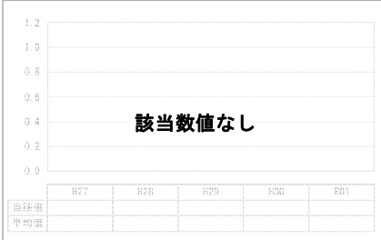
⑥有形固定資産減価償却率(%)