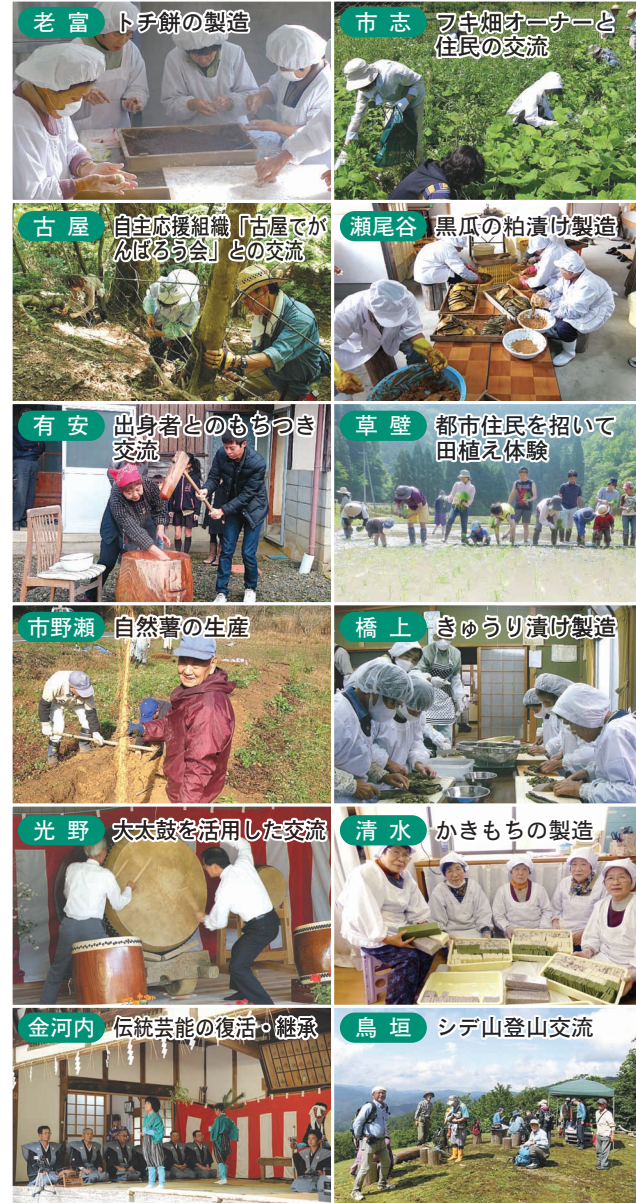
老富 ト子餅の製造