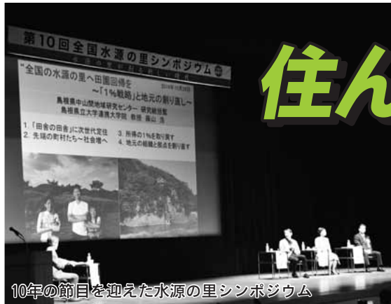
10年の節目を迎えた水源の里シンポジウム