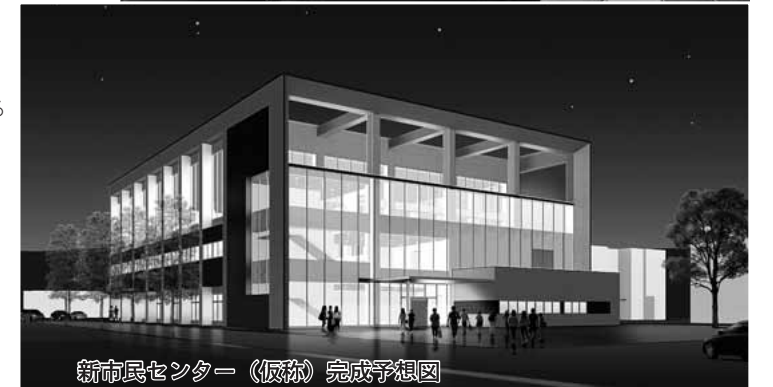
新市民センター（仮称）完成予想図