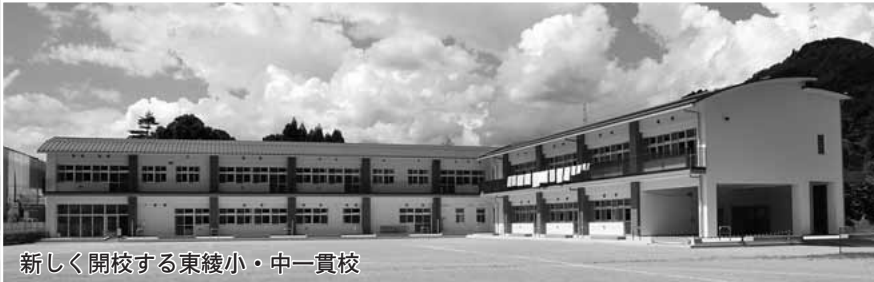
新しく開校する東綾小・中一貫校