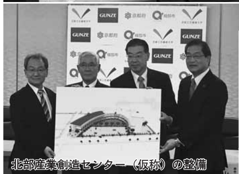
北部産業創造センター（仮称）の整備