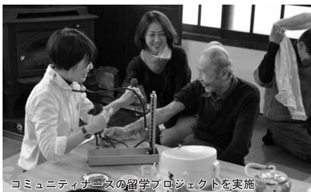
コミュニティナースの留学プロジェクトを実施

さらに、上林地域の消防救急体制の充実や西部地域の高齢者介護施設の開設など安全・安心の確保、ファミリー・サポートセンターの創設や物部保育園の整備など次世代に向けた子育て環境の充実、小中一貫校の整備など教育環境を充実させる諸施策などに積