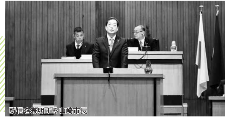
所信を表明する山崎市長