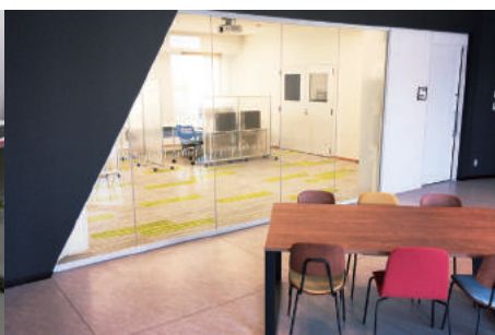
バーチャルで設計から物理的特性シミュレーションまで行える高速開発支援センター