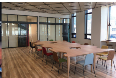
フリースペースには無料WiFiも整備予定

「住んでよかった 住みたくなる…綾部発情報すくらんぶる」は、綾部市の施策・制度・イベント・名所・活躍する個人や団体…など、綾部のホットな市政情報や旬の話題を幅広くお届けします。