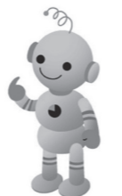
工業統計キャラクター「コウちゃん」

経済産業省工業統計調査ホームページ http://www.meti.go.jp/statistics/tyo/kougyo/index.html