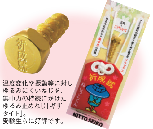
温度変化や振動等に対しゆるみにくいねじを、集中力の持続にかけたゆるみ止めねじ「ギザタイト」。受験生らに好評です。

ねじ」など同社が製造する3種類のねじをはじめ、ねじ締め機や計測機器等を展示。また、受験生応援のグッズ「ゆるみ止めねじ」や「ねじ万華鏡」など、ねじを身近に感じられる楽しいノベルティグッズもご覧いただけます。 なお、同館は土・日曜日、祝日は休館。駐車場は現在整備工事中のため、施設東側の仮設駐車場が駅周辺の市営駐車場などをご利用ください。