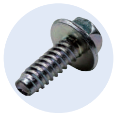
▲炭素繊維強化プラスチック用セルフタッピンねじ「CFタイト」。同社が特許を取得し、自動車の軽量化を支援するねじとして期待が高まっています。