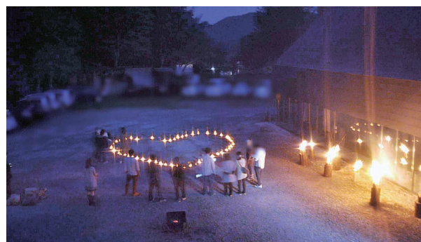
里山ねっと・あやべで開催した婚活イベントで

た活動をしたと考え、父親の出身地でなじみのある綾部市に移住。自身も地域の行事に積極的に参加するなど、地元との良い関係をじっくりと構築してきました。「綾部が大好き!多くの人に魅力を知ってもらいたい」と、婚活だけではなく、参加者と地域の人と交流できる活動も模索。市の婚活支援事業費補助金を活用したイベントをはじめ、「少子化対策」「定住促進」「地域活性化」を3本柱に、幅広く活動を行っています。