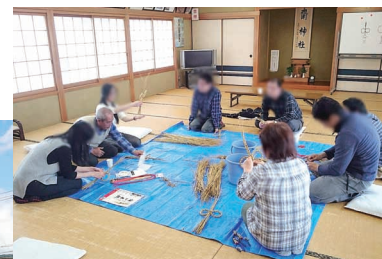
地域の人の指導のもと、しめ縄作りを体験