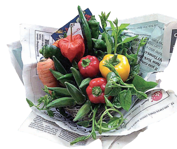
婚活イベントで行った「野菜ブーケづくり」。イベントで使用する材料も、地元産にこだわっている

今年度は府の地域力再生プロジェクト支援事業交付金を活用し、「野菜も実って恋も実る ん農園プロジェクト」を立ち上げました。地域の耕作放棄地をなんとか活用したいと考え、上原町営農組合の協力のもと、野菜作りを通してさまざまな人が交流できる場を提供。地域活性化と婚活