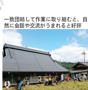
一致団結して作業に取り組むと、自然に会話や交流がうまると好評