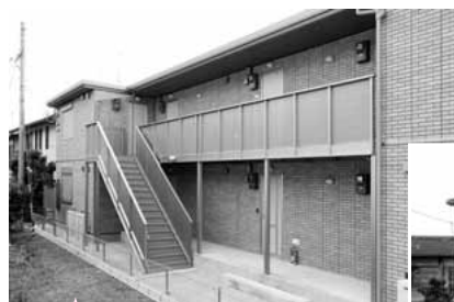
ルナコート綾部（味方町） （2LDK×4戸、1LDK×4戸）