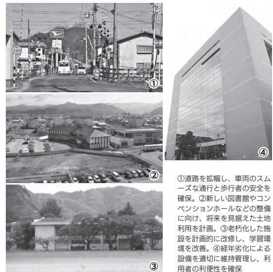
①道路を拡幅し、車両のスムーズな通行と歩行者の安全を確保。②新しい図書館やコンベンションホールなどの整備に向け、将来を見据えた土地利用を計画。③老朽化した施設を計画的に改修し、学習環境を改善。④経年劣化による設備を適切に維持管理し、利用者の利便性を確保