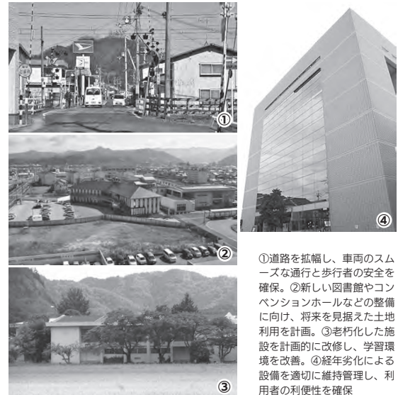
①道路を拡幅し、車両のスムーズな通行と歩行者の安全を確保。②新しい図書館やコンベンションホールなどの整備に向け、将来を見据えた土地利用を計画。③老朽化した施設を計画的に改修し、学習環境を改善。④経年劣化による設備を適切に維持管理し、利用者の利便性を確保