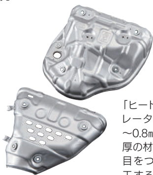
「ヒートインシュレーター」は0.3～0.8mmの薄い板厚の材料に、継ぎ目をつけずに加工する高度な技術で製造

私たちは社長の掲げている「上下一心」をスローガンに、すべての社員が人々に心地よい運転を提供するという志で製造に取り組んでいます。普段見ることがないエンジン部品を展示していますので、ぜひ一度ご覧ください。