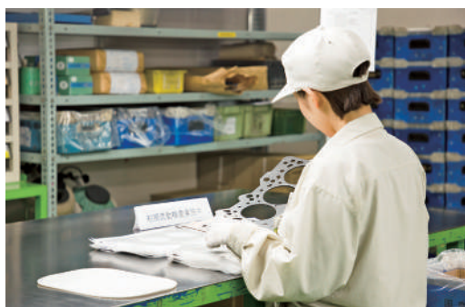
工場で製造する部品は、不備がないか一つひとつ丁寧に確認

今回は、同社が開発・生産している自動車のエンジン部品を展示。水や油、排気ガスなどの流体が外部に漏れないよう密封する「ガスケット」やエンジンから発生する熱や音を遮断する「ヒートインシュレーター」などの主力製品が並びます。また、同社の製品が使用されている自動車の模型とともに、どの部分に製品が使用されているのかわかりやすく解説したパネルなども展示されています。