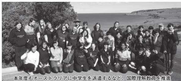
本年度もオーストラリアに中学生を派遣するなど、国際理解教育を推進