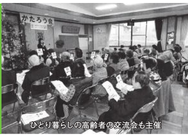
ひとり暮らしの高齢者の交流会も主催

本年度、制度創設100周年を迎える民生委員・児童委員。今回は、その活動をご紹介します。