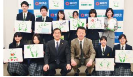
コミカルに表情を変えるまゆピーの原画

スタンプは、原画のイラストを生徒が自由な発想で作画し、市が画像データとして編集。文字入れなどを行い、40