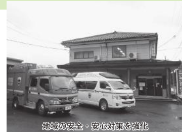
地域の安全・安心対策を強化