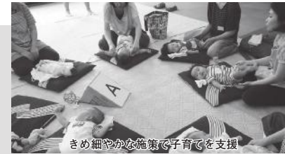
きめ細やかな施策で子育てを支援