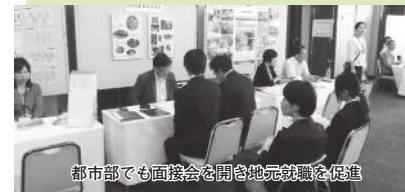
都市部でも面接会を開き地元就職を促進