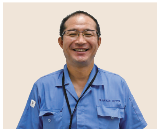
住友理工ホーステックス

同社は顧客のニーズに合わせた製品を提供するため、1000種類以上の製品を扱っています。今回展示するのは、主力製品である、建設機械などに使われている高圧ホース。重機を動かすために必要な油圧を送る部品です。また、生コンクリートやオイル、魚など、液体から個体までさまざまなものを運ぶ運送用ホースも展示されます。