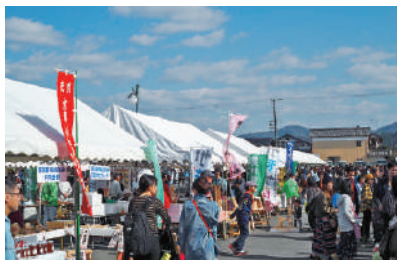
上/フルーツカービングの実演と体験教室を実施（当日受付） 下/水源の里集落の特産品なども販売します（いずれも5日）