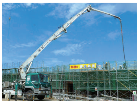
ホースが1つ無くなると、工事が中断するほど重要な部品

住友理工ホーステックス（本社、とよさか町）は平成25年、住友理工グループの産業用ホース事業部の製造拠点として設立。平成28年に同事業部の運営拠点が同社に移り、グローバル展開の中心を担っています。同社は主に、産業用のホースを製造。各種産業機械などに多く使われています。