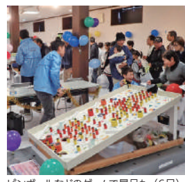
ピンボールなどのゲームで景品も（6日）

駐車場は、あやべグンゼスクエア（青野町）や由良川花庭園（同）、あやべ・日東精工アリーナ（西町三丁目）などに約600台分を確保しています。周辺商業施設には絶対に駐車しないようお願いいたします。駐車場の混雑が予想されます。あやべバスの利用や徒歩、自転車での来場にご協力ください。