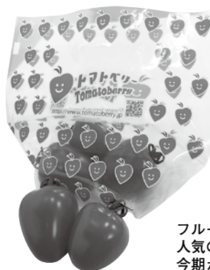
フルーティーな甘さで人気のトマトベリーは、今期から栽培開始

今期もさらに、ビニールハウス16棟を増設。気象変化に応じたハウスの温度管理や水量等の工夫で、生産力の向上に努めます。また、新たにトマトベリーを栽培するほか、好評の寒味ホウレンソウの露地栽培も継続します。さらに、西部地域の3つの農業生産法人と共同で壬生菜の栽培に挑戦。同社が生産指導を行い、壬生菜の産地化を目指します。