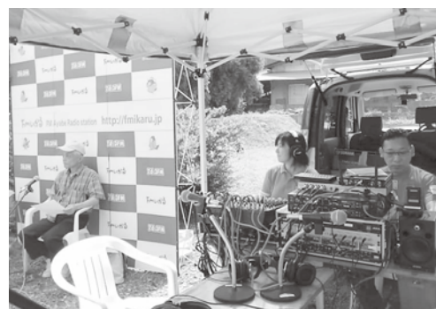
エリアの広がった志賀郷地区からの受信対策PR放送

同社は、ラジオ放送のほか映像制作やイベントの司会など多方面で活動。地域のにぎわい創出に貢献しています。昨期は、ドローンを活用した災害時の情報収集について、市と協定を締結。市民の安全・安心にも寄与しています。また、近畿コミュニティ放送賞CM部門において、2年連続で最優秀賞を受賞。特別番組部門においても全国水源の里シンポジウムと水源の里10年をテーマに制作したドキュメンタリーが最優秀賞に輝くなど、高い評価を受けています。