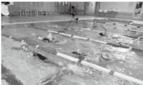
大会出場や記録更新を目指すスイミング選手コース