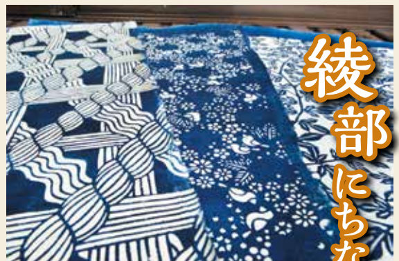
▶『綾型』で藍に染めた和紙。左から「生糸」「イカル（市の鳥）」「コウゾ」。次は「ねじ」を構想中とか