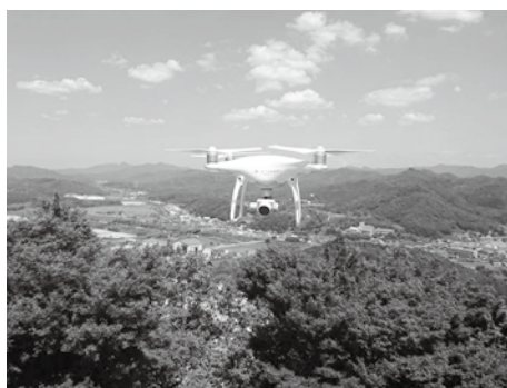
ドローンを駆使した映像事業も好評