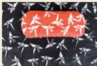
▲朱に染めた和紙の眼鏡入れ。下に敷かれているのが型紙（黒）

黒谷町でこのほど、同町などを舞台とした映画「なまくら」の撮影が行われました。東映京都撮影所で時代劇等を手掛ける監督や技術スタッフの有志でつくる、右京太秦芸能人会によるものです。時代劇映画を使ったまちづくりに取り組む同会の▽地域の産業を盛り立てる▽時代劇に携わる人材育成—などを目的とした活動の一環。秋にはDVDが完成し、市内での上映会等も行われる予定です。