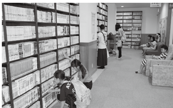
市民の皆さんの協力で約1万冊がそろうマンガ図書館